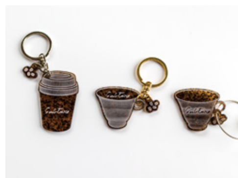
製品事例：キーホルダー