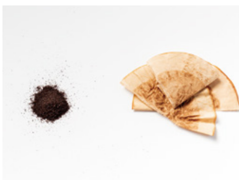
使用済みのコーヒー豆とフィルター