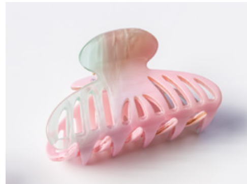
製品事例：バンスクリップ