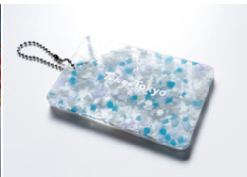
製品事例：モーターキー